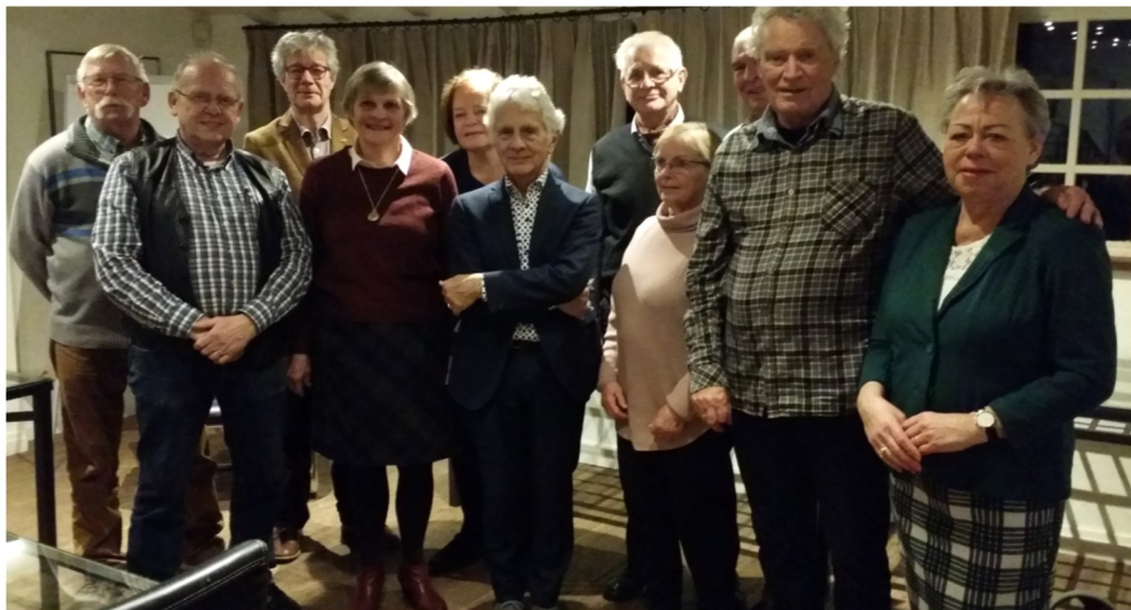
Bemensing en verdeling aandachtsgebieden Seniorenraad.